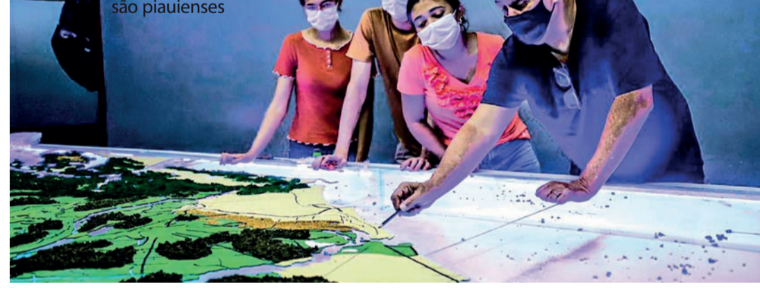
MAIOR parte dos visitantes ao local são piauienses

Nas instalações do Museu, Rick informa que há três espaços para museografia, duas galerias para exposições temporárias em artes visuais, uma biblioteca, três salas para formações para evento, sendo elas, o Parque das Ruínas e o Galpão do Porto.