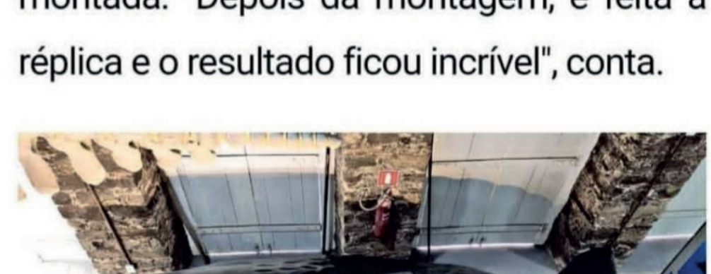
Réplica da baleia cachalote fica pronta no Museu do Mar, no Porto das Barcas

O trabalho de construção da réplica da baleia cachalote durou mais de seis meses. A ossada foi recolhida na Ilha do Caju e depois recebeu um tratamento e foi toda montada. "Depois da montagem, é feita a réplica e o resultado ficou incrível", conta.